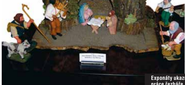
Exponáty ukazují, jak přesná musí být práce řezbáře.

Výstavy děl známých i méně známých umělců Vysočiny, které celoročně připravuje krajský odbor kultury a památkové péče ve vstupních prostorách kongresového centra sídla kraje Vysočina, upoutávají pozornost